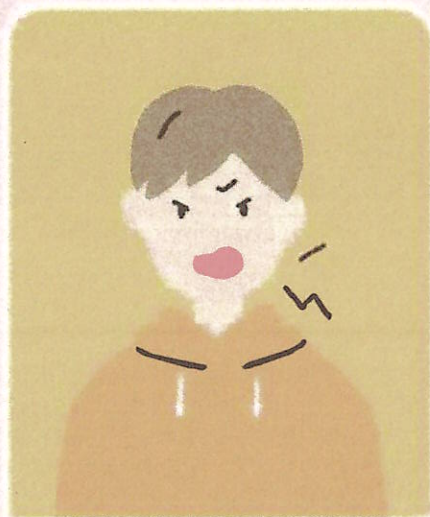
怒りやすくなった