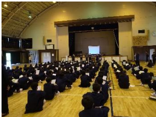
【新入生オリエンテーション】