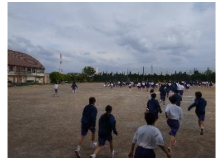
【地震を想定した避難訓練】

新緑がまぶしく、爽やかな風が心地よい季節となりました。新年度が始まり一か月が過ぎ、生徒たちは新しい学級や友人関係の中で、少しずつ自分の居場所を見つけながら学校生活に慣れてきています。朝の登校時には、進級した2・3年生に加えて、中学校生活を新たに始めた1年生も「おはようございます」と気持ちの良い挨拶を交わしています。時間割に従って授業が始まり、委員会活動や部活動には1年生の姿も見られるようになり、今年度の教育活動が本格的に始動しました。生徒たちにも、笑顔が見られるようになり、学校全体に活気があふれてきています。保護者、地域の皆様におかれましては、日頃より本校の教育活動にご理解とご協力をいただき、心より感謝申し上げます。