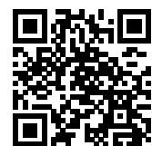
連絡メール2 保護者ログイン

学校・お子様の追加やその他登録内容を変更する場合 右記の「保護者ログイン用二次元コード」を読み取り、保護者サイトに接続します。 * その際、登録したメールアドレスとログインパスワードを入力します。 * 保護者サイト https://renraku.education.ne.jp/parent/ パスワードを忘れた場合 上記登録と同様に空メールを送信すると、パスワードの再設定ができます。 * 保護者登録しているメールアドレスがご利用できない場合は、パスワードの再設定ができません。